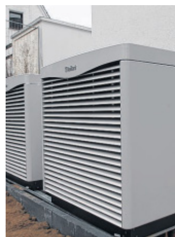
Herzstück der Heizungstechnik: Die Wärmepumpen von Vaillant.