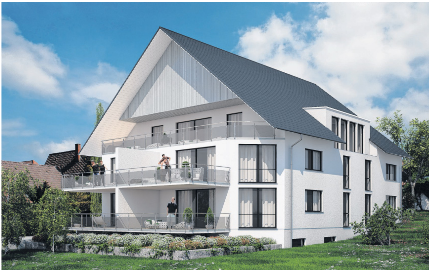
So wird es aussehen: Die fotorealistische Computergrafik zeigt das Haus, wenn es fertig ist. Es liegt direkt am Bad Salzufler Kurpark.