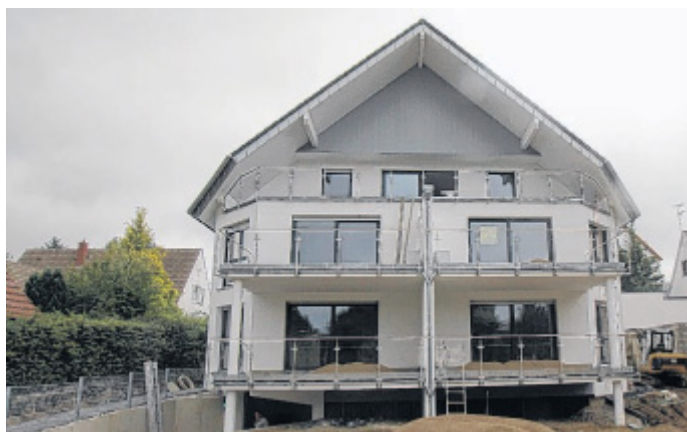
Nur noch ein paar Handgriffe: Das Haus an der Lietholzstraße 36 in Bad Salzuflen wird in Kürze übergeben.

modernster Anlagentechnik. Der Energieverbrauch beträgt maximal 55 Prozent des Wertes, der durch die Energieeinsparverordnung vorgegeben wird. Diese Bauweise wird mit einem zinsgünstigen Darlehen der Kreditanstalt für Wiederaufbau (KfW) und einem Tilgungszuschuss von 2.500 Euro gefördert, so Gäbler.